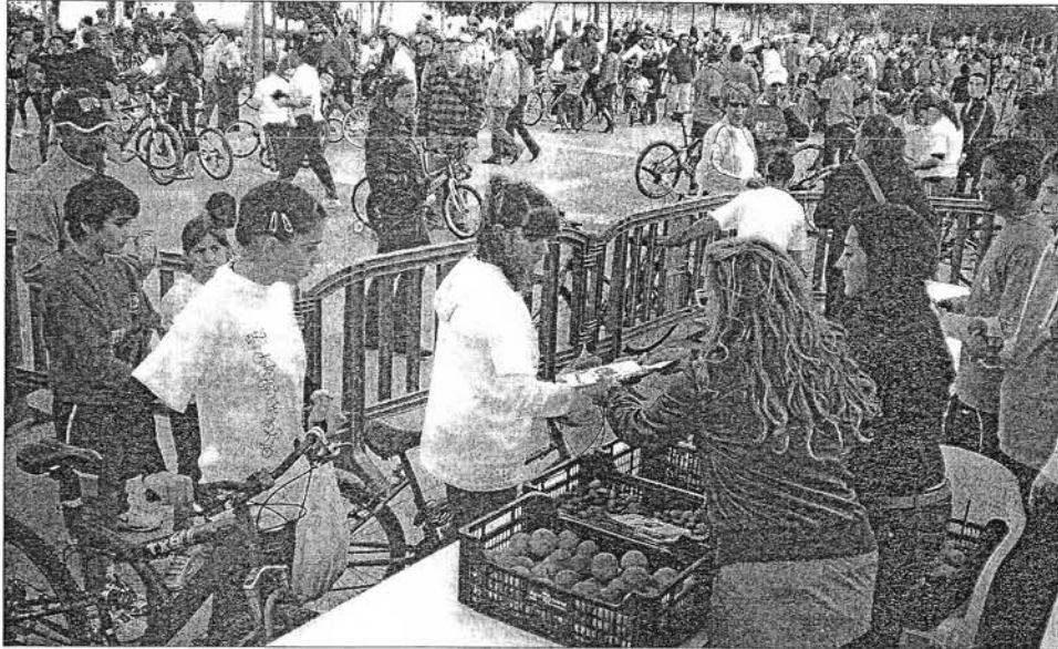
Los voluntarios del proyecto Thao-Salut Infantil repartieron entre los más jóvenes trípticos informativos y una merienda sana.

El proyecto Thao-Salut Infantil, que previene la obesidad infantil, celebró su primer acto en Eivissa en el marco del Día del Pedal