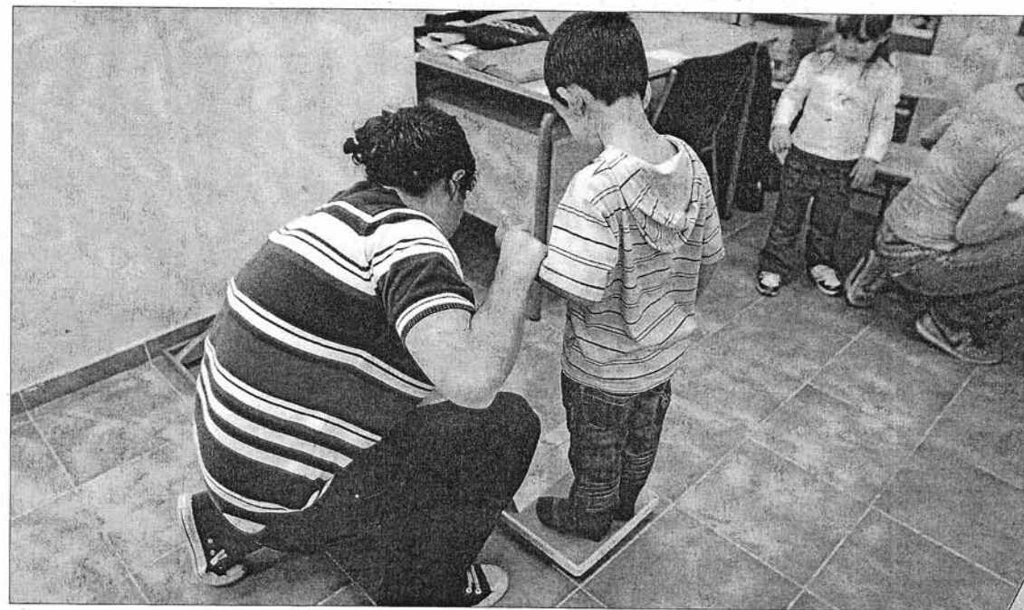
Uno de los primeros ejercicios de esta primera fase del programa Thao-Salut Infantil fue pesar a los alumnos.

El programa Thao-Salut Infantil tiene como objetivo prevenir la obesidad infantil a través del fomento de actividad física y una alimentación sana y variada. Para que los niños identifiquen el lado más lúdico de este proyecto la organización ha creado cuatro muñecos llamados tahóines que representan el